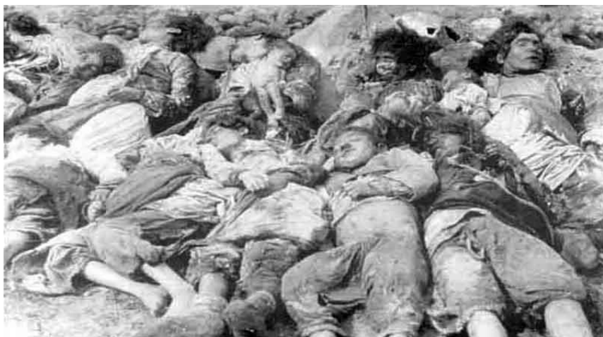
Мирное турецкое население, уничтоженное армянами в Субатане, 25 апреля 1918