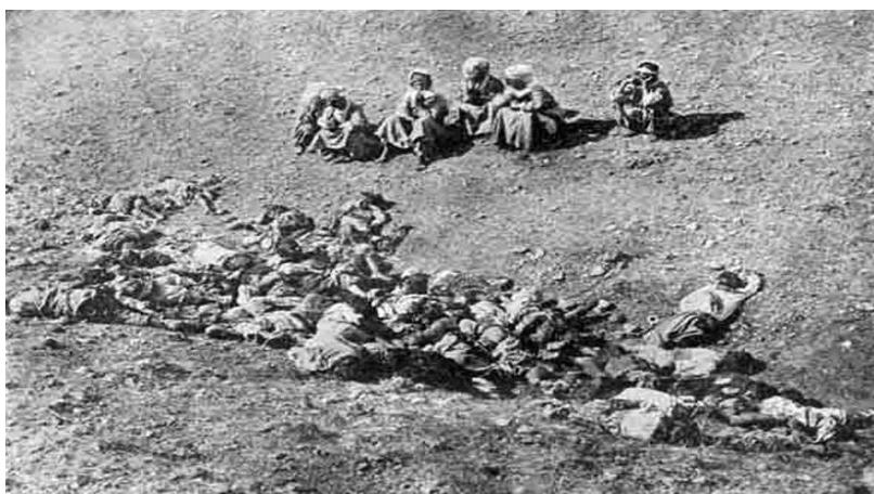
Мирное турецкое население, вырезанное кинжалами и убитое огневым оружием армянскими террористами в ущелье Мерсани. 23 июля 1915