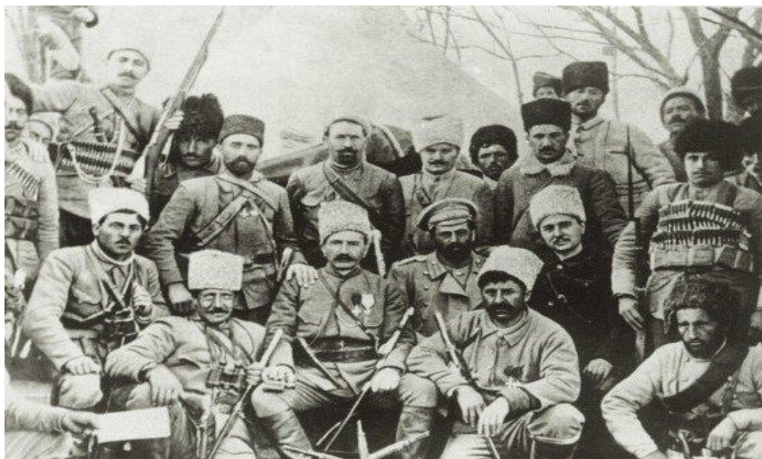
Андраник Озянян и его вооруженный отряд, подвергший мусульман Восточной Турции массовому истреблению, 1916