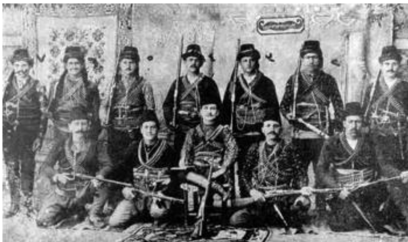
Армянские террористические формирования, действовавшие в районе Анкары и Ёзгата