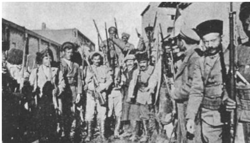
Один из армянских отрядов, ворвавшихся в Чёрный вторник в дома мирных жителей, уничтоживший и ограбивший их