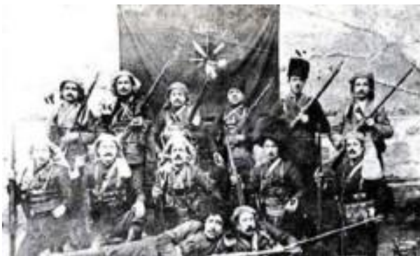
Группа армянских вооруженных бандитов