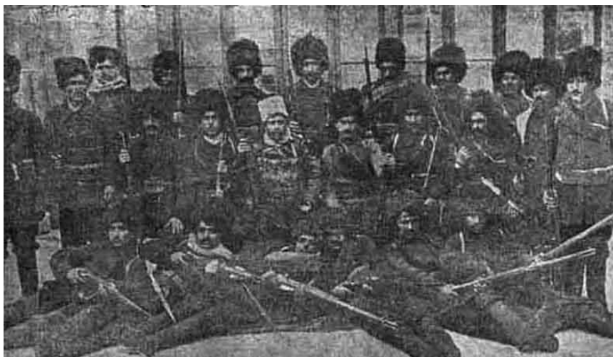
Отряд армянских террористов из Гнчак, 2 марта 1915