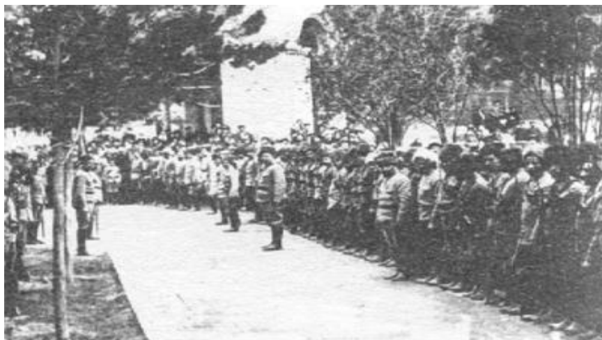
Отряд дашнаков в Урмии, 1918