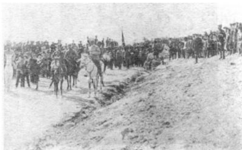
Фрагмент нападения армянских дашнаков на Урмию, 1918